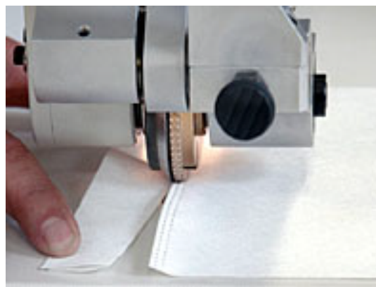
PFAFF 8310 CS dual

További információval készséggel állunk rendelkezésére.