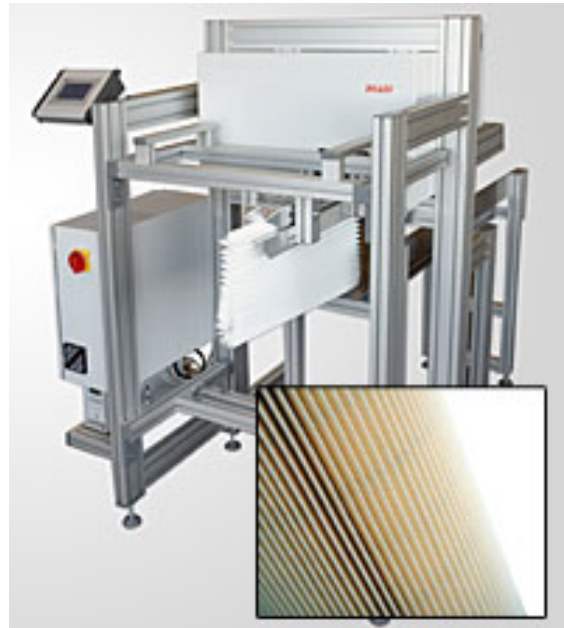
ÚJ! „Csillag” formájú filter gyártására szolgáló berendezés

Az átalakult - német tulajdonú - Pfaff új fejlesztéseiben komplett kész gyártósorok tervezését, kiegészítő állomások kiépítését kínálja vevőinek.